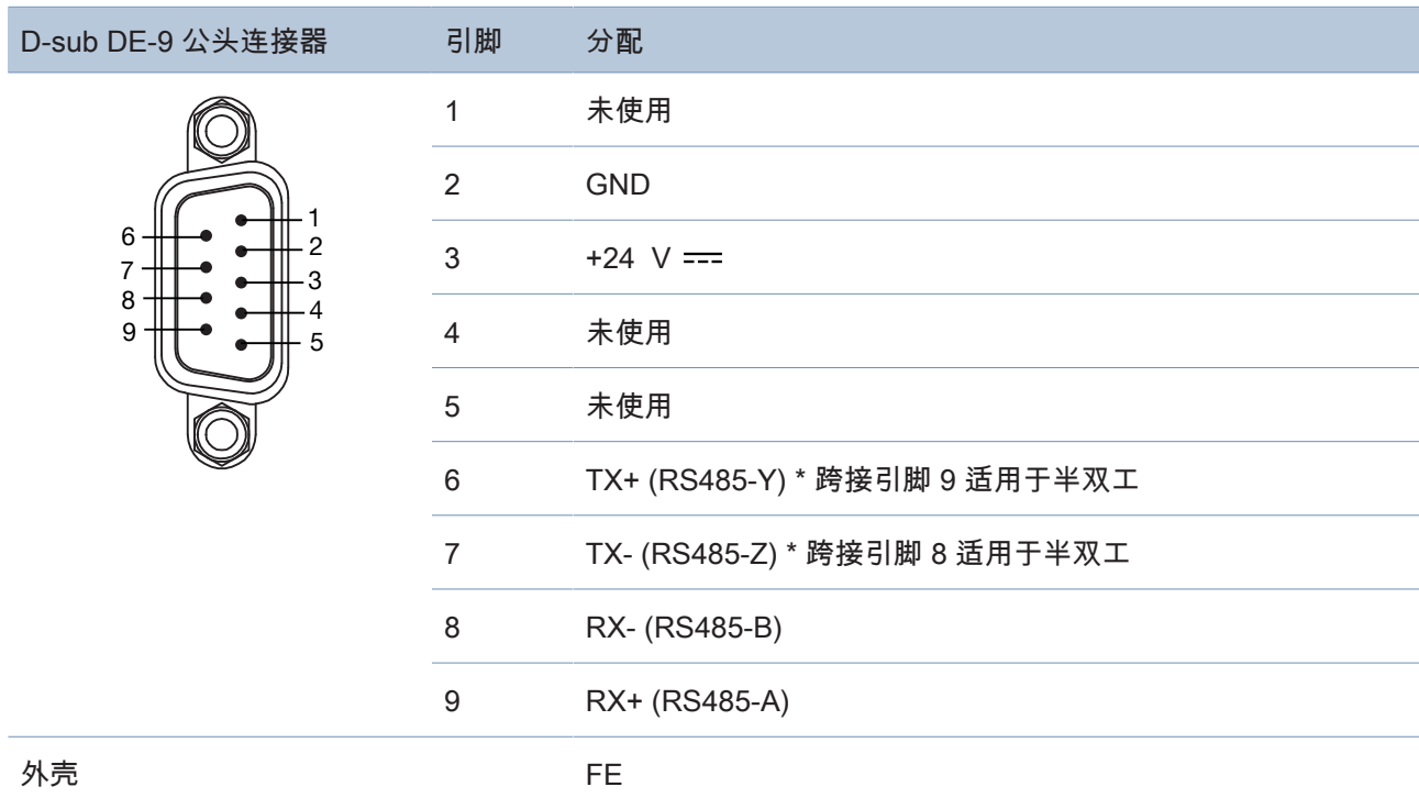
表 1: 设备的 D-sub DE-9 公头引脚分配