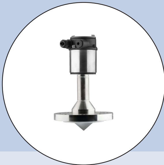
LEVEL TRANSMITTER LT8138