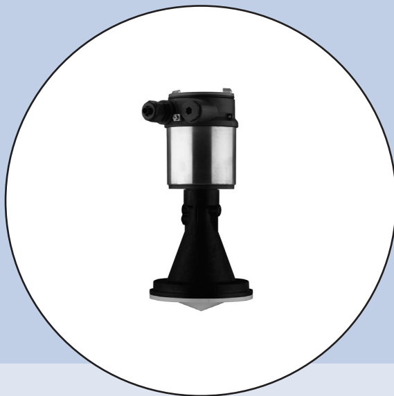
LEVEL TRANSMITTER LT8136

Sécurité intrinsèque PTB 08 ATEX 2002 X Deux fils 4 ... 20 mA/HART