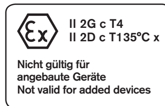
Fig. 1: Identification pour la zone Ex