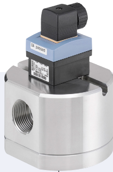
Typ SE30 + S077 kombinierbar mit